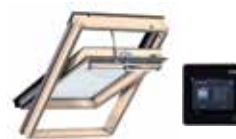
Ventana giratoria solar VELUX INTEGRA®