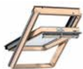
Ventana giratoria manual