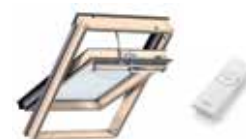
Ventana giratoria eléctrica VELUX INTEGRA®