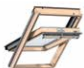
Ventana giratoria manual