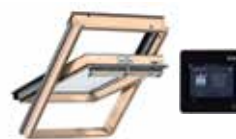
Ventana giratoria solar VELUX INTEGRA®