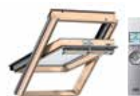
Ventana giratoria eléctrica VELUX INTEGRA®. Puede instalar cualquier cortina, toldo o persiana eléctrica, sin tener que instalar motores adicionales.