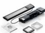
Kit de conversión solar KSX 100K